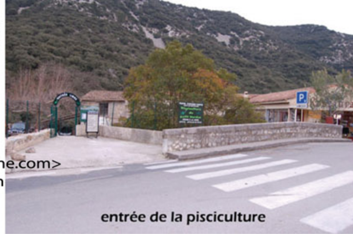
entrée de la pisciculture