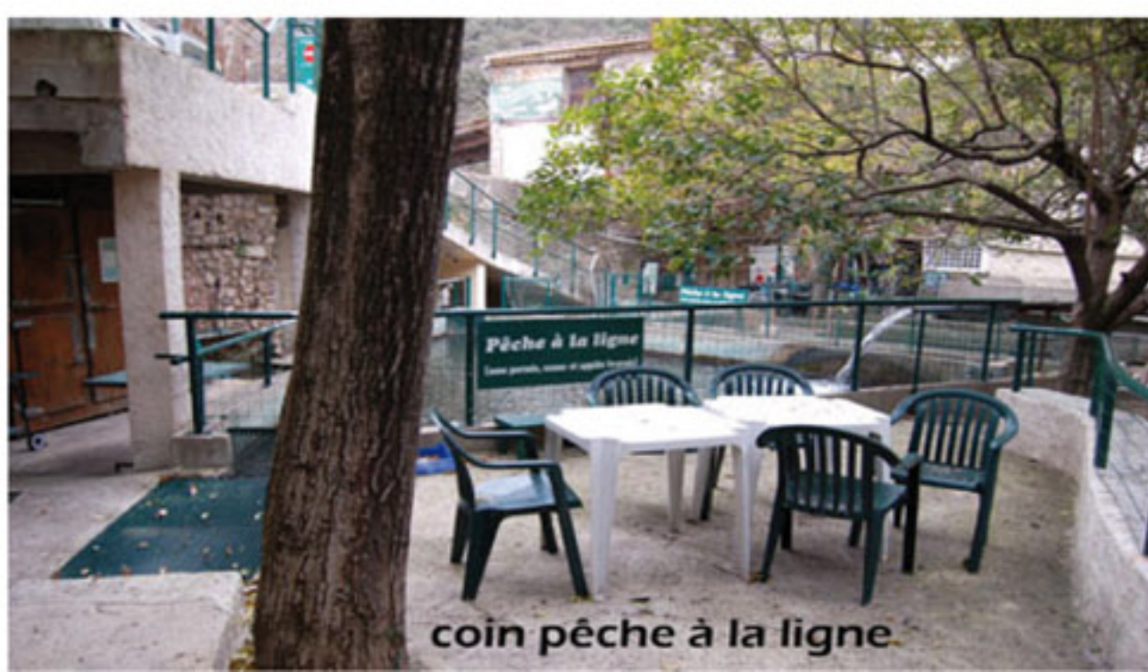
coin pêche à la ligne