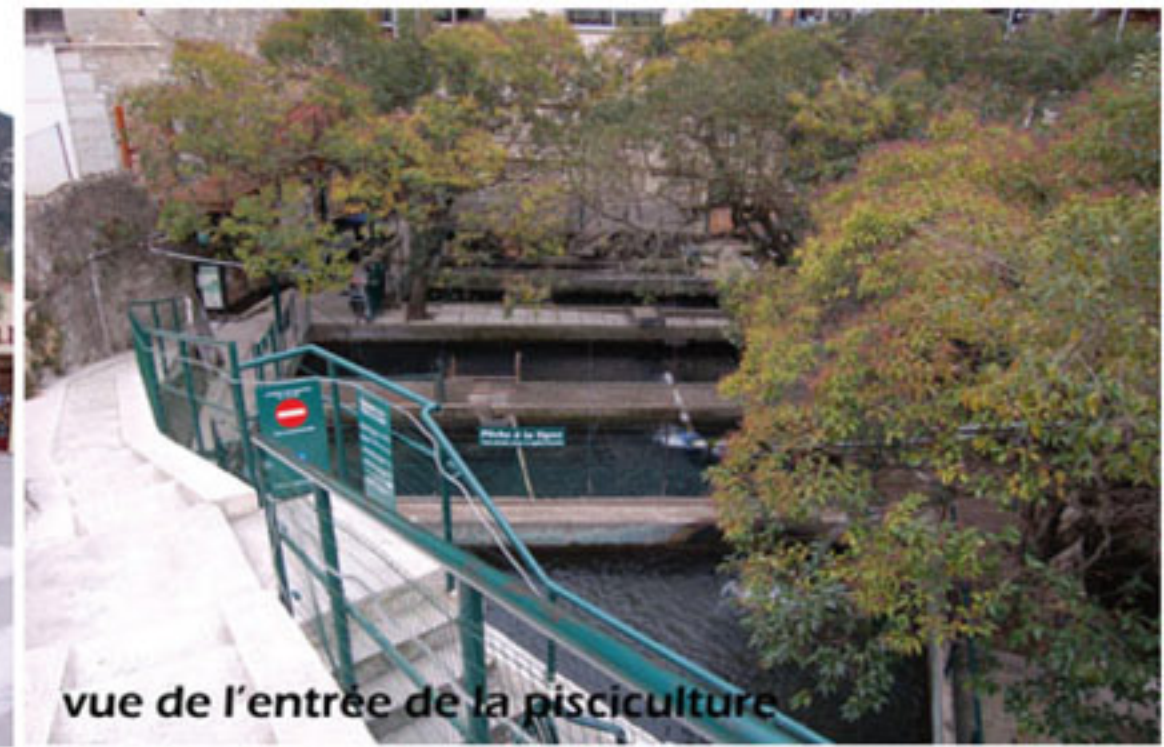
vue de l'entrée de la pisciculture