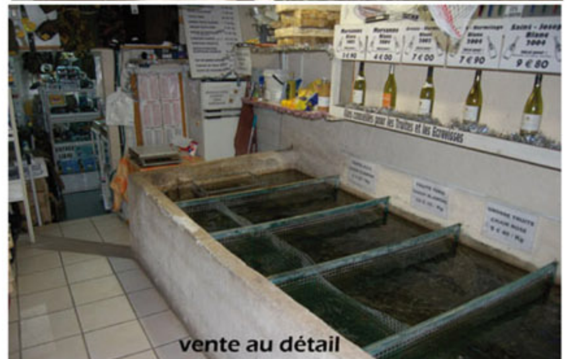
vente au détail